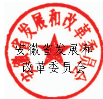
安徽省发展和 改革委员会