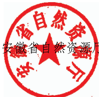
安徽省自然资源厅