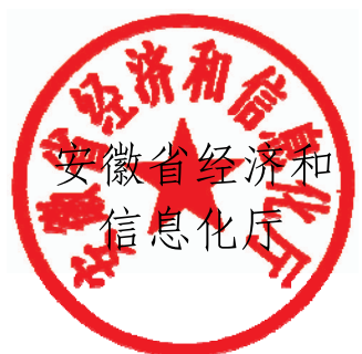
安徽省经济和 信息化厅