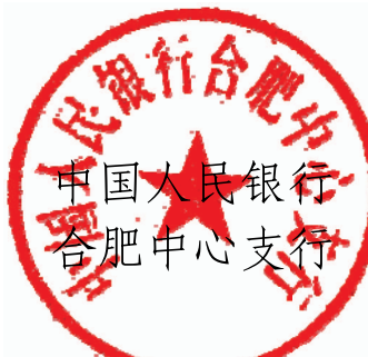
中国人民 银行 合肥中心支行