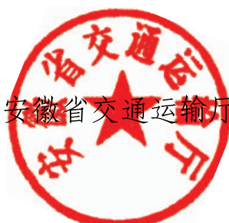
安徽省交通运输厅